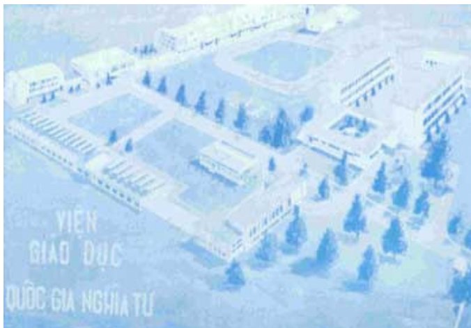
Mô hình Viện Giáo Dục QGNT

Sau gần 20 năm phân chia, gia đình QGNT có cơ hội đoàn tụ vào năm 1992 tại Orange County, miền nam Cali. Đó là lần gặp gỡ đầu tiên giữa học sinh, giáo sư ở Hoa Kỳ để cùng ôn lại kỷ niệm cũ tại ngôi trường thân yêu này. Lần đoàn tụ thứ nhì cũng được tổ chức vào năm 1993 tại nam Cali. Mười năm sau, năm 2003 tại San Jose, bắc California, Đại Hội Tương Phùng đã quy tụ gần 350 cựu thầy cô và học sinh từ khắp nơi trên thế giới, gặp lại nhau sau gần 30 năm từ ngày rời xa mái trường Mẹ. Trong dịp Đại Hội này, tên gọi Gia Đình Quốc Gia Nghĩa Tử được chính thức ra đời. Sau đó vào các năm 2005 và 2007, các đại hội QGNT tiếp theo được tổ chức tại Dallas, Texas và Orange County, California. Năm nay 2009, đại hội QGNT được tổ chức tại San Jose, bắc California.