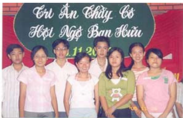
Một số em học sinh được nhận học bổng của GDQGNT