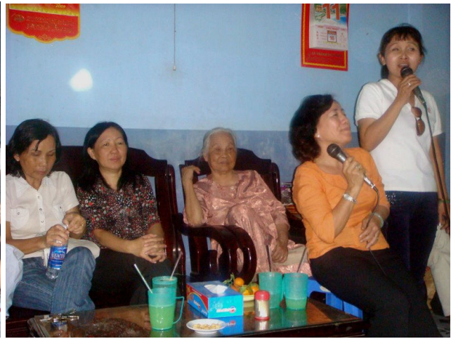
Con hát Mẹ khen ...H.A..Y