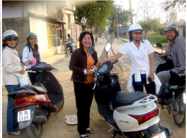
Hà hà ... qua rồi con đường đau khổ, cả nhóm cười hả hê...