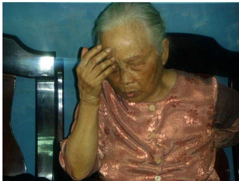
Để Mẹ nghĩ xem.....Hồi đó.....!

Mẹ nói : Chỉ ngày Chủ Nhật các con về thăm Mẹ, và hôm nay, có chúng con nhà Mẹ mới đông vui như thế thôi.