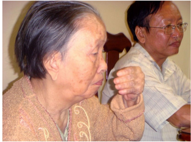
Và bây giờ 2009