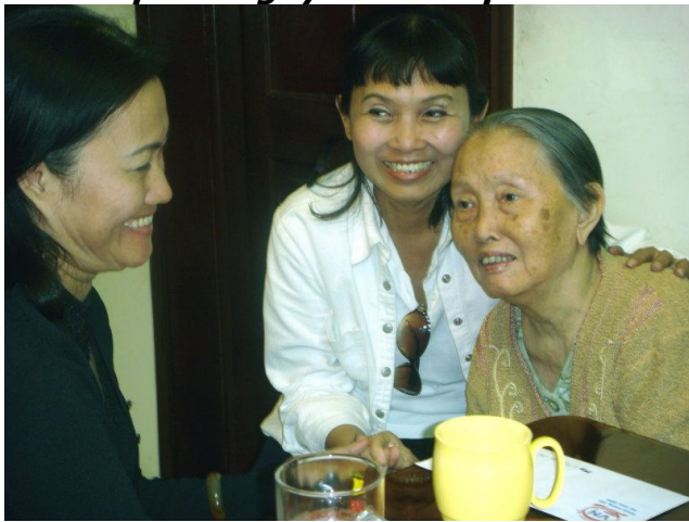
Tươi cười cùng Mẹ