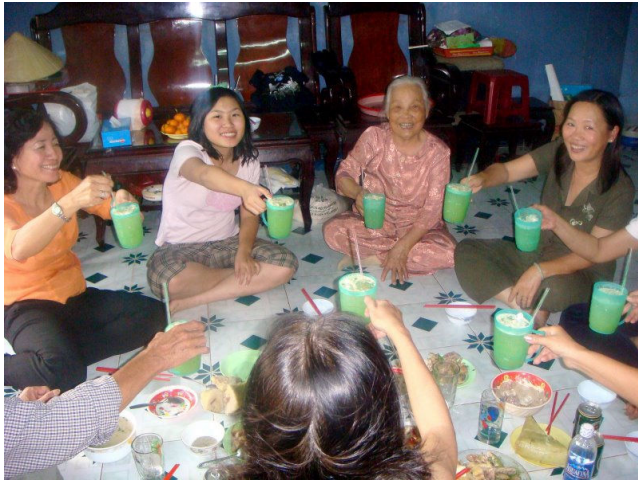
Mẹ con ta cùng uống nhé....1.2.3....