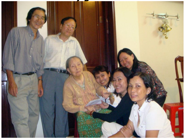
và ngả nghiêng cùng Mẹ

Ra về là đã trưa, gọi cho Thúy Hiền hỏi nhà Mẹ, may mắn là Thúy Hiền cũng đang ở nhà với Mẹ bên Q12. Đã trưa lại đói và đường còn quá xa, Nhưng lời mời của Thúy Hiền cũng quá hấp dẫn.