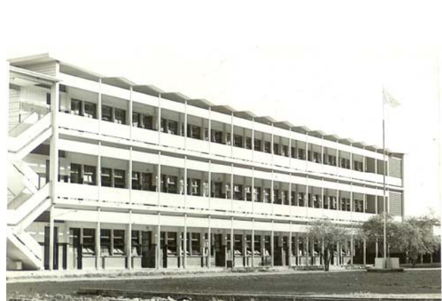
Một dãy phòng học