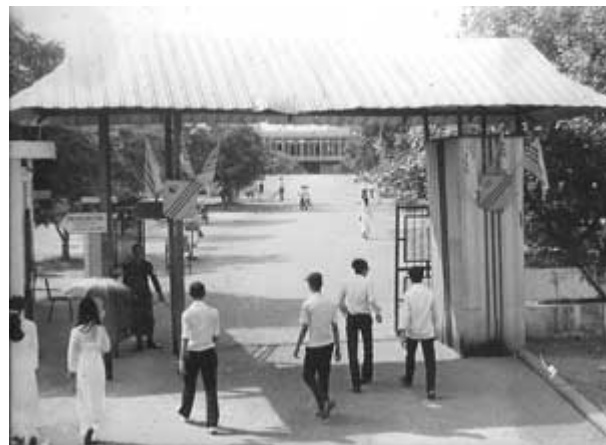
Cổng Trường QGNT Sài Gòn