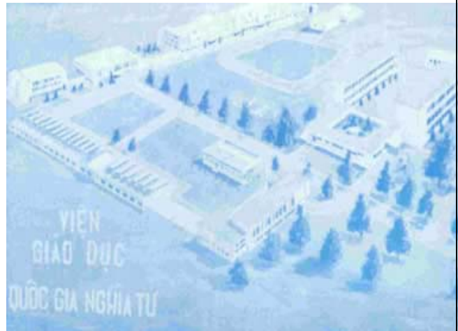
Mô hình Viện Giáo Dục QGNT

Sau gần 20 năm phân chia, gia đình QGNT có cơ hội đoàn tụ vào năm 1992 tại Orange County, miền nam Cali. Đó là lần gặp gỡ đầu tiên giữa học sinh, giáo sư ở Hoa Kỳ để cùng ôn lại kỷ niệm cũ tại ngôi trường thân yêu này. Lần đoàn tụ thứ nhì cũng được tổ chức vào năm 1993 tại nam Cali. Mười năm sau, năm 2003 tại San Jose, bắc California, Đại Hội Tương Phùng đã quy tụ gần 350 cựu thầy cô và học sinh từ khắp nơi trên thế giới, gặp lại nhau sau gần 30 năm từ ngày rời xa mái trường Mẹ. Trong dịp Đại Hội này, tên gọi Gia Đình Quốc Gia Nghĩa Từ được chính thức ra đời. Sau đó vào các năm 2005 và 2007, các đại hội QGNT tiếp theo được tổ chức tại Dallas, Texas và Orange County, California.