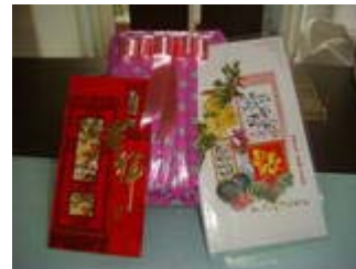
Quà Của Mẹ 71

Quà Nhớ Mẹ của Q 71 ngoài một hộp kẹo ( mua bánh sọ mở ra lâu sẽ mềm ) , thiệp chúc Tết còn một phong bao có 400 ngàn mà các bạn hải ngoại gửi về, cảm ơn tất cả anh chị em đã có lòng, chúng tôi sẽ là người mang tình thương mến này đến từng Mẹ của chúng tôi ..Q 71