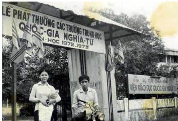
Cổng Trường Quốc Gia Nghĩa Tử Sài Gòn